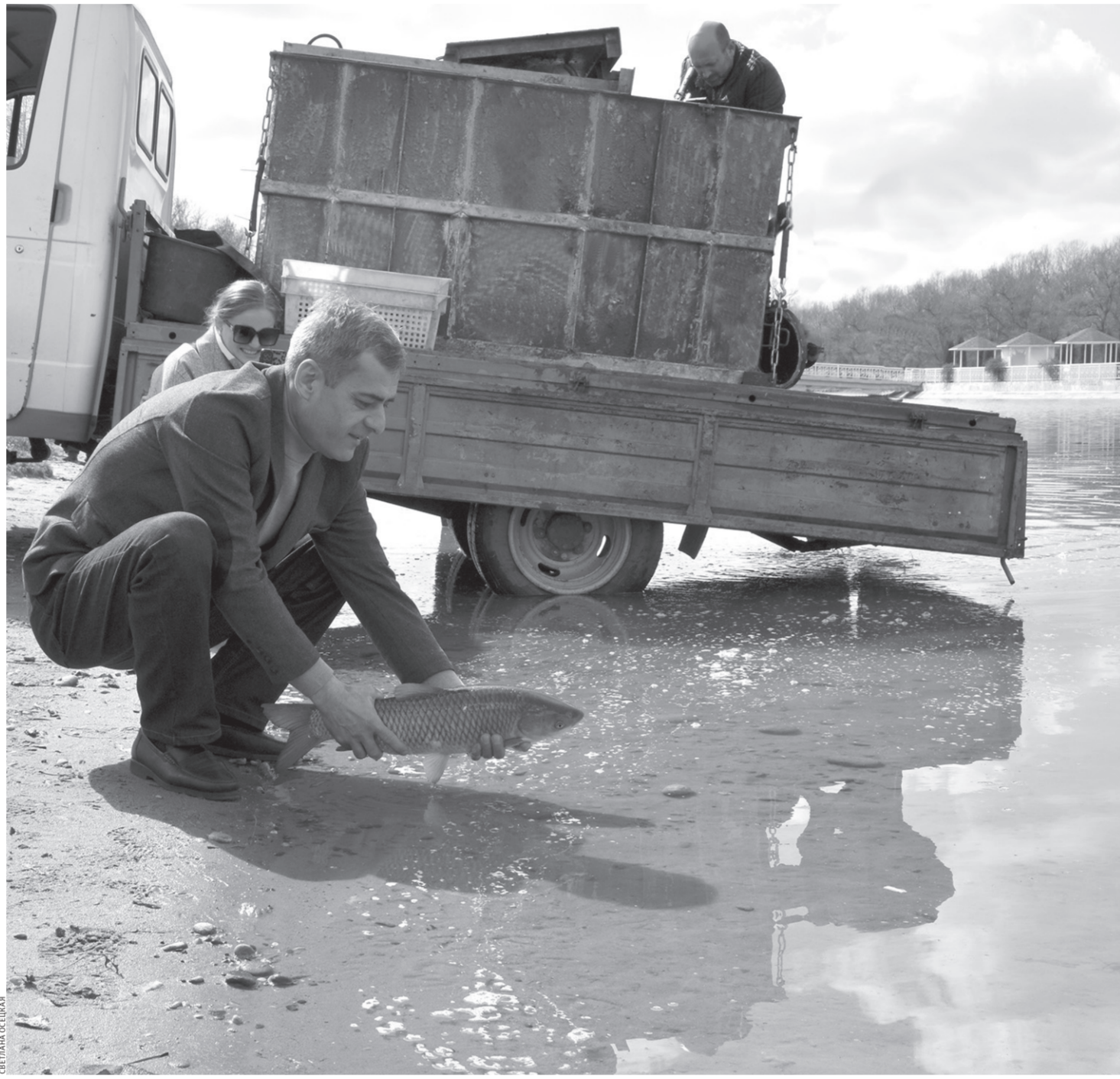
Через два-три года эта рыбка достигнет 6–7 килограммов

Еще больше интересных новостей на сайте denresp.ru